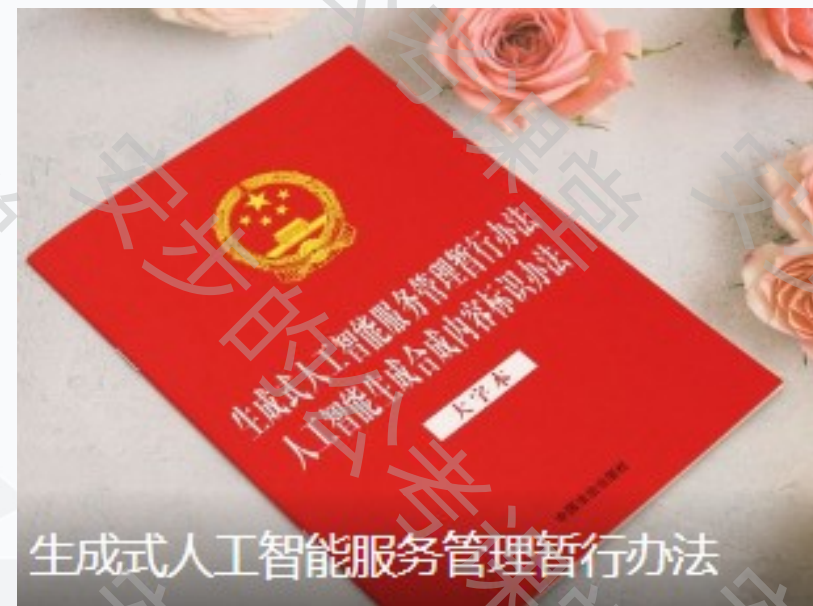
生成式人工智能服务管理暂行办法

【案例展示】 国家互联网信息办公室等部门发布《生成式人工智能服务管理暂行办法》，明确禁止生成违法、偏见、侵犯隐私的内容，从法律层面为 AI 划定“向善”的底线。